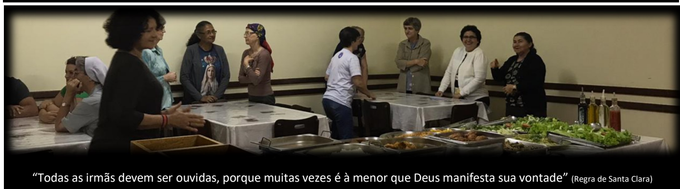
“Todas as irmãs devem ser ouvidas, porque muitas vezes é à menor que Deus manifesta sua vontade” (Regra de Santa Clara)