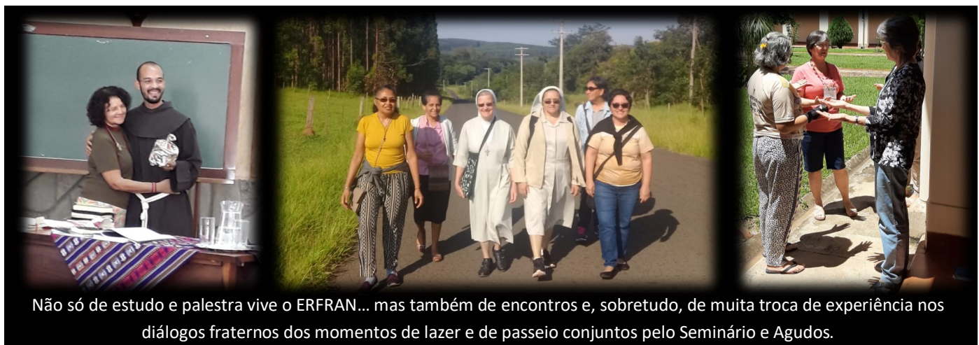
Não só de estudo e palestra vive o ERFAN... mas também de encontros e, sobretudo, de muita troca de experiência nos diálogos fraternos dos momentos de lazer e de passeio conjuntos pelo Seminário e Agudos.