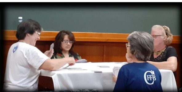
O lúdico também faz parte do programa do ERFRAN... Recreios e jogos divertem os “erfranitas”