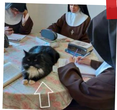
#espíritofraternocffb #clarrisas #famíliafranciscana