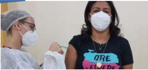
#ofsvacinasm Vacina Sim!