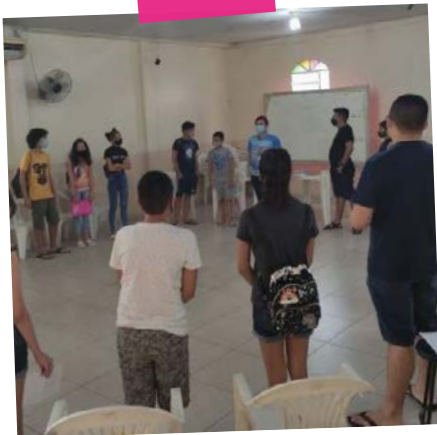
#juframanaus #jufradobrasil #jufra #jufrista

No Canal do YouTube da CFFB Clique e Inscreva-se