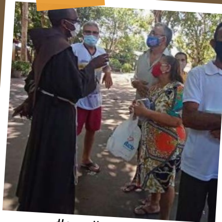
#sav #pazebem #vocações

USE SEMPRE #espíritofraternocffb #famíliafranciscana #sãofrancisco #santaclara #pazebem #cffb