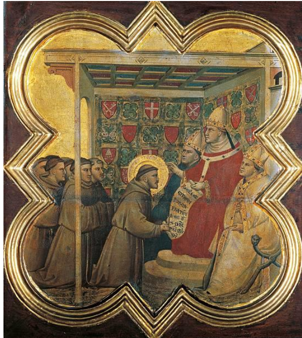
Innocent III approving the Franciscan Rule

nós somos esposas quando a alma fiel é unida pelo Espírito Santo a nosso Senhor Jesus Cristo. nós somos irmãos, mais do que isso, quando fazemos a vontade de Seu Pai que está nos céus; nós somos mães quando O carregamos em nosso coração e corpo pelo amor e por uma consciência pura e sincera; e fazemos com que Ele nasça por meio de atividades sagradas, que devem brilhar diante dos outros pelo exemplo. Segunda Carta aos Fiéis de São Francisco, versos 51-53