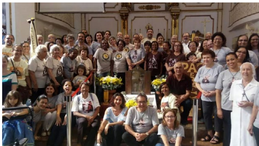
Dia 17 de abril aconteceu o Encerramento da Peregrinação da Relíquia de São Francisco de Assis, em Niterói, Igreja da Porciúncula. Fraternidades OFS do Nosso Regional se fizeram presentes. Um grande momento de cultura do encontro e fraternismo.