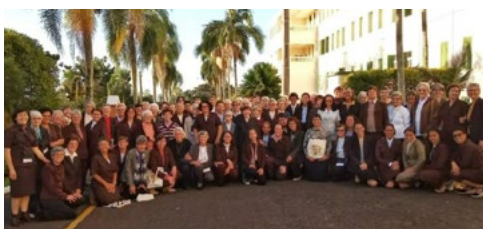
IV Capítulo Brasileiro de Esteiras, IFPCC