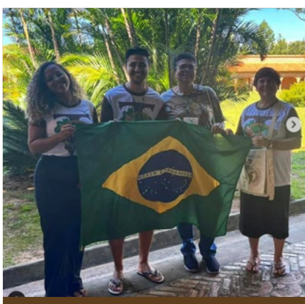
XI Congresso Latinoamericano e I Congresso Americano OFS