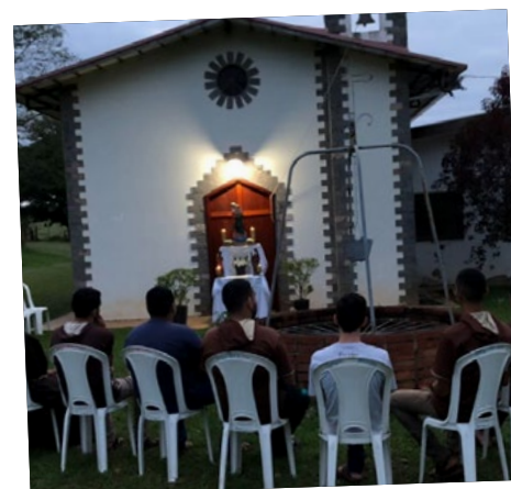
#FradesFranciscanosOFM #PazEBem #SaoFranciscoDeAssis