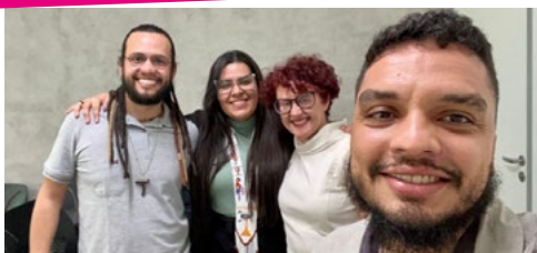
Rede franciscana para Migrantes, agenda no Ministério da Saúde