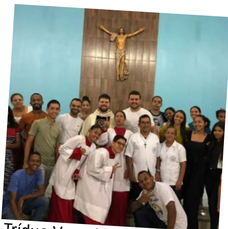
Tríduo Vocacional na Paróquia Santa Dulce - OFMConv