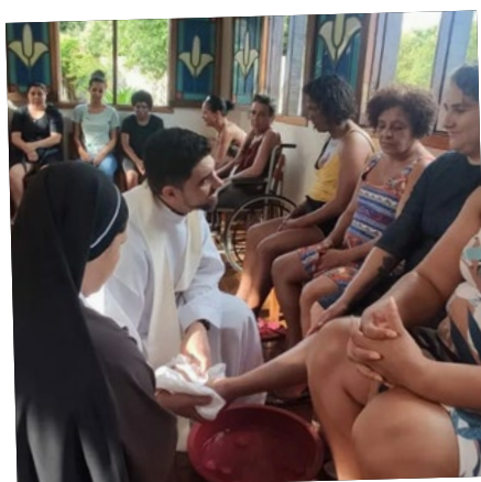
Franciscanas da Providência Lar Madre Paulina