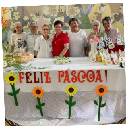
Confraternização de Páscoa Sede Geral IMC