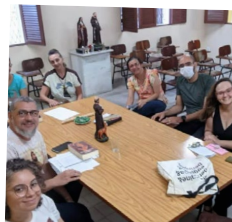
Grupo de meditação franciscana das fontes | OFS Caicó