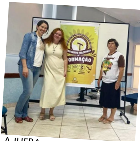
A JUFRA marcou presença no Enc. Nac. de Formação da OFS