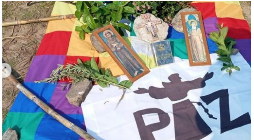
Irmãs Catequistas celebram São Francisco de Assis #IrmãsCatequistasFranciscanas #VidaReligiosaConsagrada #AnoVocacional2023 #SãoFrancisco #CasaComum