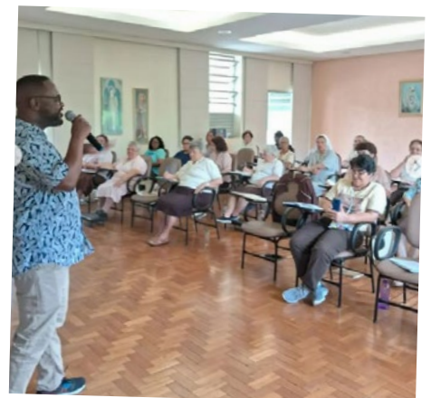
Clarissas Franc. refletem sobre Racismo Estrutural e Homofobia.