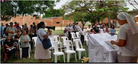
Campanha Missionária 2023 #anovocacional23