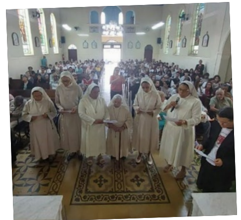
IFSCJ | Renovação de votos religiosos diante da comunidade