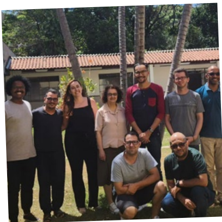
SAV OFM - Santa Cruz - partilha de trabalhos e refletir sobre acolhida.