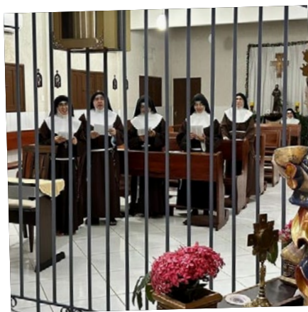
Clarissas de Mossoró - RN recebem visita de Santa Luzia.