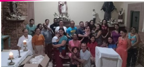
Dia dedicado a padroeira da OFS, Santa Izabel da Hungria