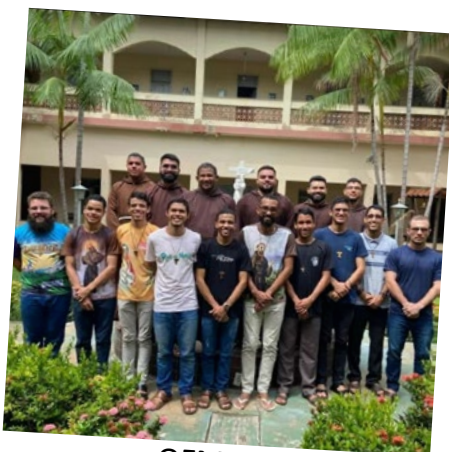
OFM Cap Semana Vocacional 2023