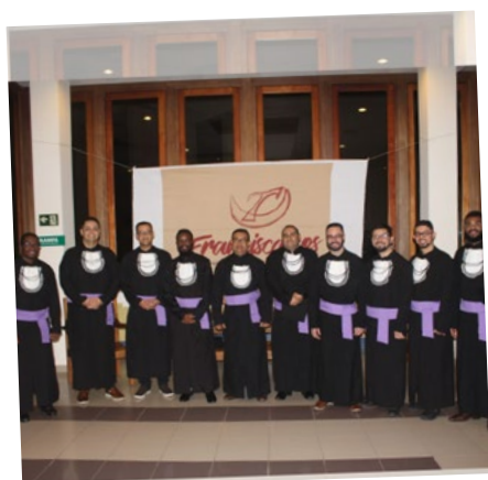
Cerimônia de Colação de Grau do curso de Teologia 2023 - ITF