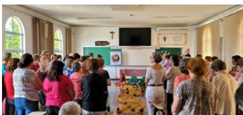
XVI Assembleia Capitular da Província SFA - Abertura | CICAFA