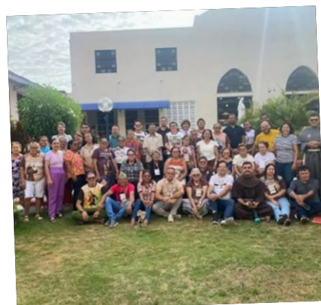
I Capítulo Avaliativo da OFS Ceará