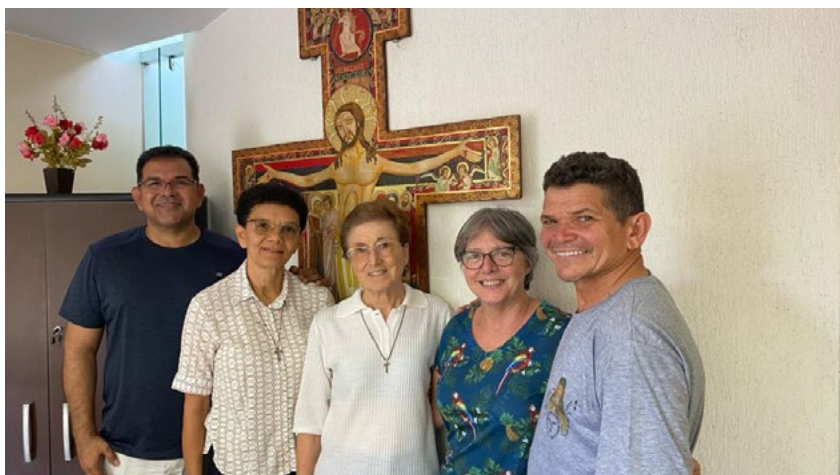
Conselho Diretor da CFFB reconhece o quanto é importante trabalharmos juntos na promoção e animação da nossa Família Franciscana