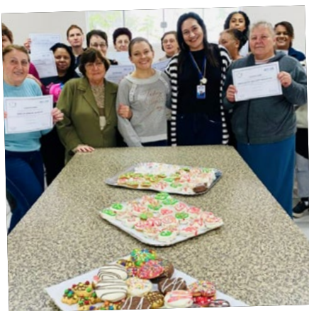
Curso gratuito de bolacha caseira decorada