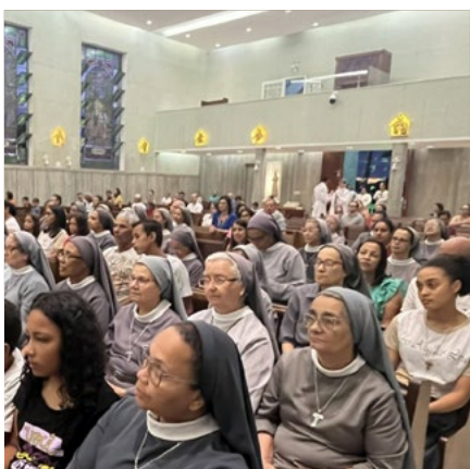
Celebração de acolhida das irmãs para o retiro anual