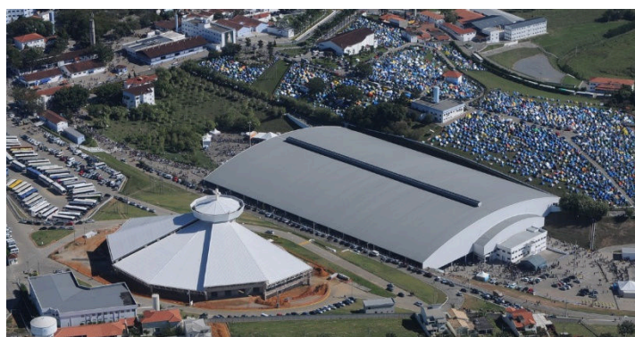
Canção Nova Cachoeira Paulista/SP