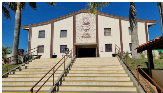
Santuário Frei Galvão Guaratinguetá/SP