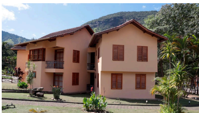
Fazenda a Esperança – Pedrinhas Guaratinguetá/SP