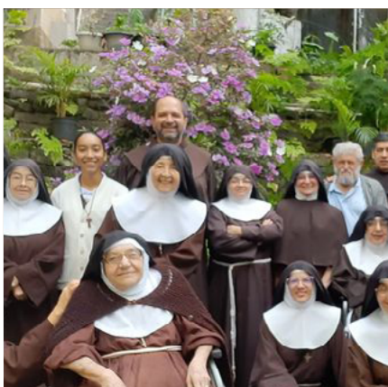
Clarissas da Gávea recebem visitas de frades