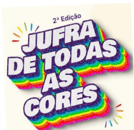
Parceria da JUFRA, Coletivo Empatia Clarifranciscana e o SINFRAJUPE