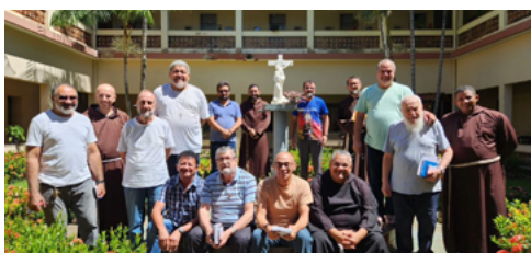
OFMCap celebram o jubileu de prata da Província N. Sra. do Carmo