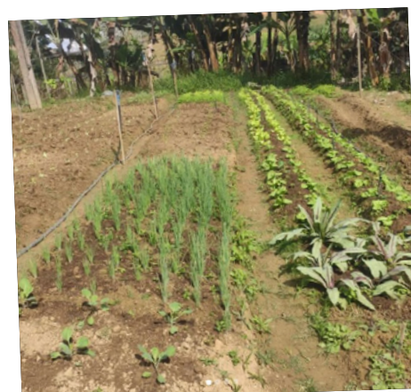
Conheça a magia da Vila Franciscana!