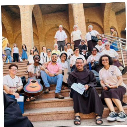
Clarissas Franciscanas celebram encerramento de Jubileu