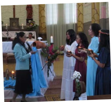
“Não Percam de Vista seu Ponto de Partida”. Etapa de Formação.