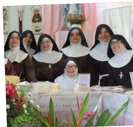
Clarissas de Canindé celebrando Santa Clara.