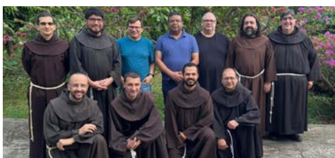
Ecônômicos das entidades da CFBB e Cone Sul se reúnem em São Luís/MA