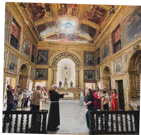
Celebrando o patrono da OFS, São Luís, rei da França.