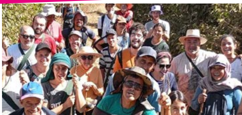
FSMA Caminhada Franciscana 2024