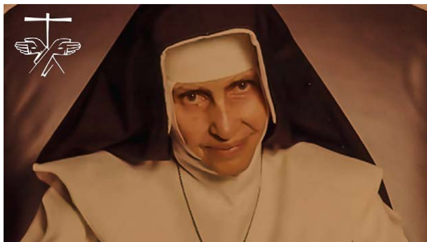
13 de agosto, celebramos a festa de Santa Dulce dos Pobres, porque, foi nesta data, em 1933, que ela ingressou na Congregação das Missionárias da Imaculada Conceição da Mãe de Deus, em Sergipe, com 19 anos de idade.