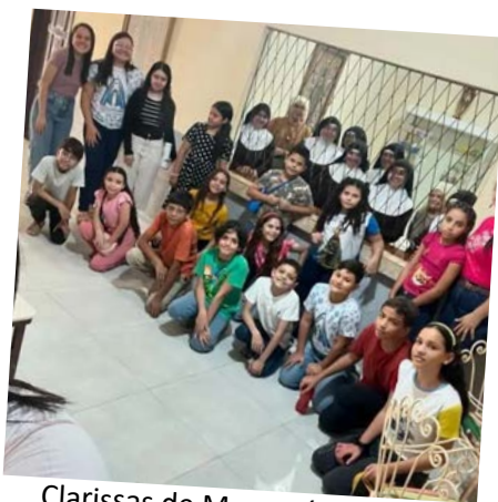
Clarissas de Mossoró recebem visita de catequizandos.