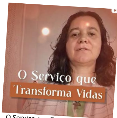
O Serviço que Transforma Vidas | Franciscanas da Providência.