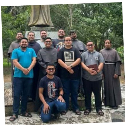
Encerramento da Missão em Teresina - PI | OFM Conventuais.