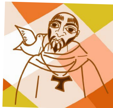
Francisco de todos os povos. No caminho da paz sejamos testemunhas.