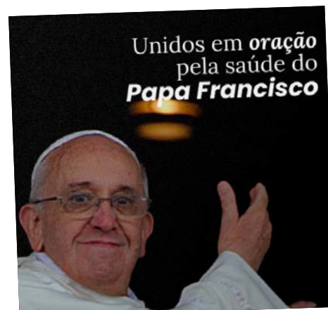
Unidos em oração pela saúde do Papa Francisco.