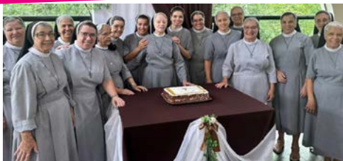
Um sonho realizado | 150 anos das Franciscanas Seráficas.