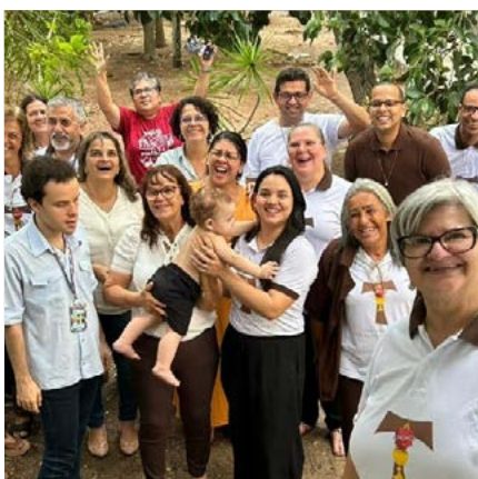
Fraternidade e Alegria | OFS Coração.