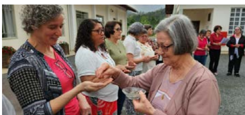
Peregrinas da Esperança, no caminho da Paz! | Catequistas Franciscanas.