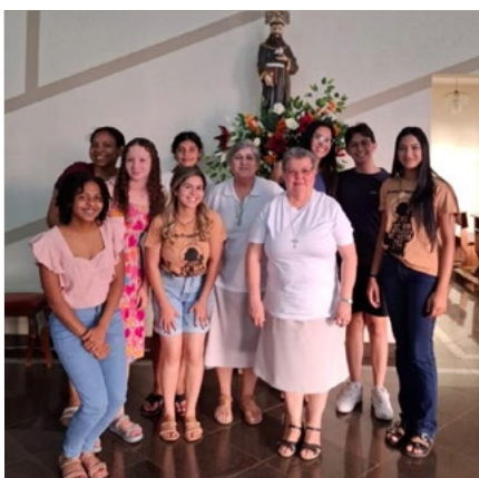
Franciscanas da Penitência partilham o carisma franciscariano