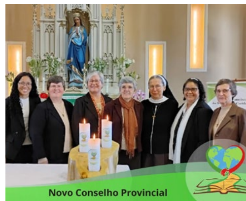
Novo Conselho Provincial