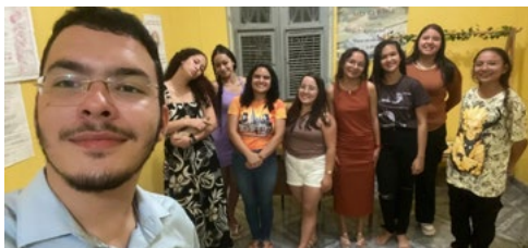
JUFRA Instrumentos da Paz realizam o 2º Encontro PROVOCAE