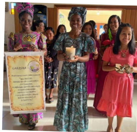
Catequistas Franciscanas: Consagração a serviço do Reino