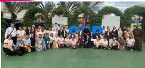
Família Franciscana registra participação na 27ª AGE da CRB Nacional