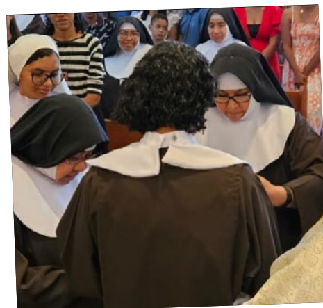
Clarissas Capuchinhas acolhem duas noviças