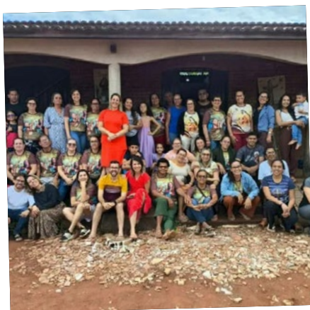
Frat. de Campo Formoso realiza Acampamento Paz e Bem