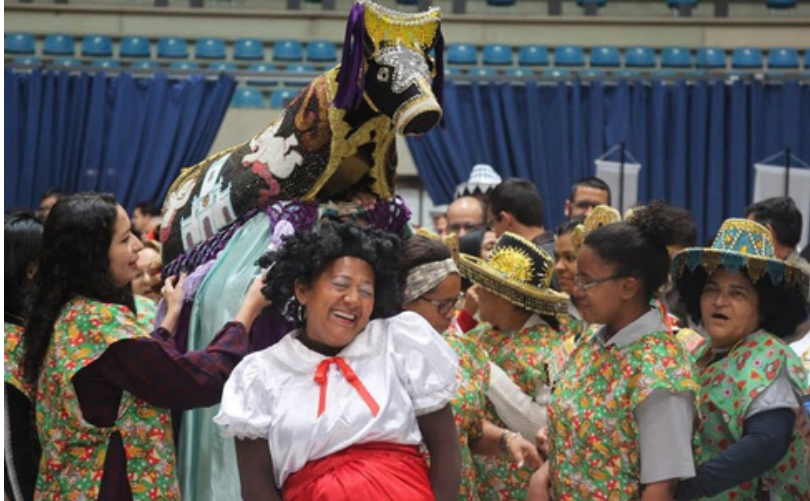
NOITE CULTURAL DO CAPÍTULO DAS ESTEIRAS 2017

Oração do ano jubilar franciscano, Papa Leão XIV